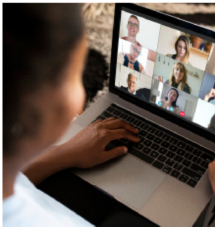
Les décryptages : contribuer à l'outillage des acteurs de l'ESS

Pour en savoir plus et prendre part aux différents formats proposés, contactez :